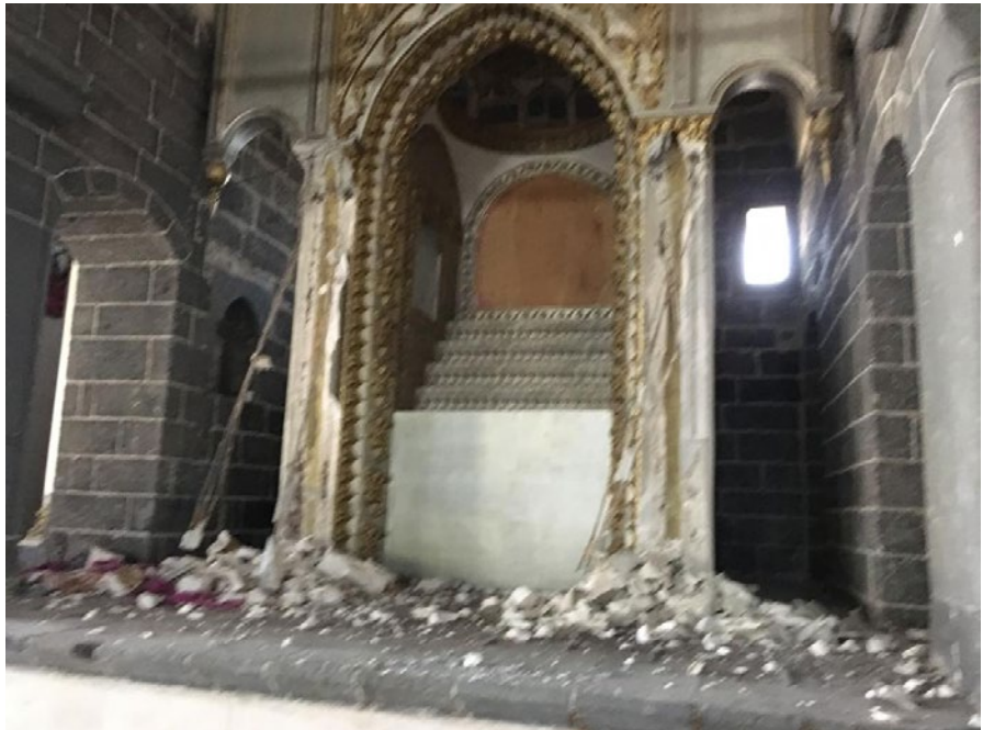
Surp Giragos Kilisesi iç görünüm

Surp Giragos Kilisesi'nin uğradığı tahribatın ve 4 yıl boyunca kullanılamamış olmasının etkisi restorasyonun sağladığı canlanma göz önüne alındığında daha iyi anlaşılabilir: