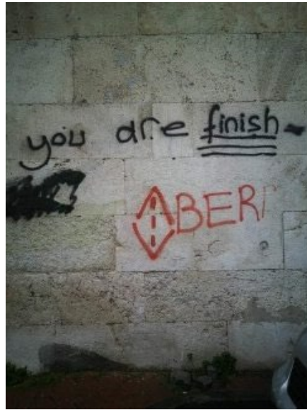
Surp Takavor Ermeni Kilisesi

23 Şubat 2019 tarihinde gece 10.30 sularında İstanbul'un Balat semtinde yer alan Surp Hreşdagabet Ermeni Kilisesi'nin duvarına kimliği belirsiz kişi ya da kişiler tarafından tehdit içeren ifadeler yazılmıştır. 57 Mardin Protestan Kilisesi'nde sürekli olarak polis koruması bulundurulmaktadır.