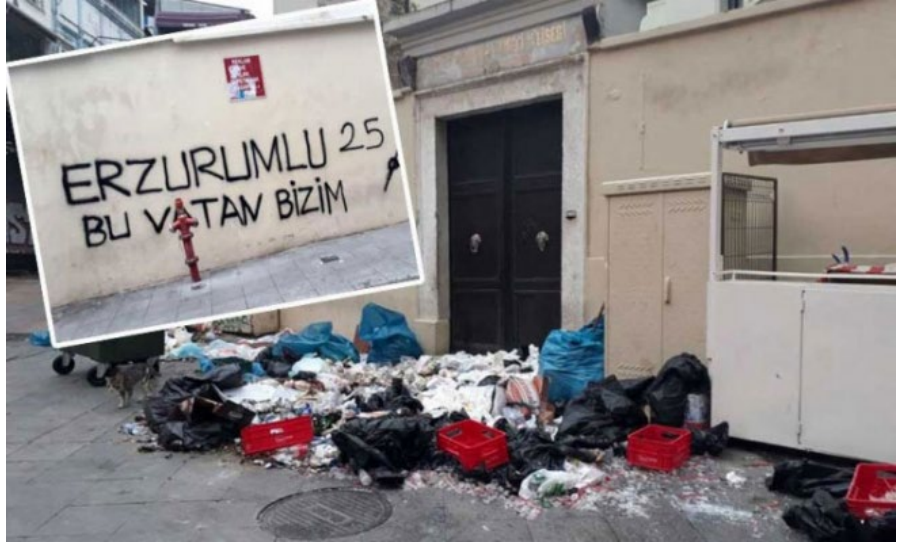
Surp Takavor Ermeni Kilisesi

3 Mayıs 2018 tarihinde, Bursa'da bulunan Kestel Hacı Bektaş-ı Veli Kültür Merkezi ve Cemevi'nin duvarlarına ve çevresine, yüzü maskeli ve kimliği belirsiz bir kişi tarafından hakaret ve küfür içeren yazılar yazılmıştır. Cemevi görevlilerinin haber vermesi üzerine Bursa Emniyet Müdürlüğü ile Kestel ilçe Emniyet Müdürlüğü ekipleri tarafından şüphelinin yakalanması için başlatılan soruşturma devam etmektedir. 53